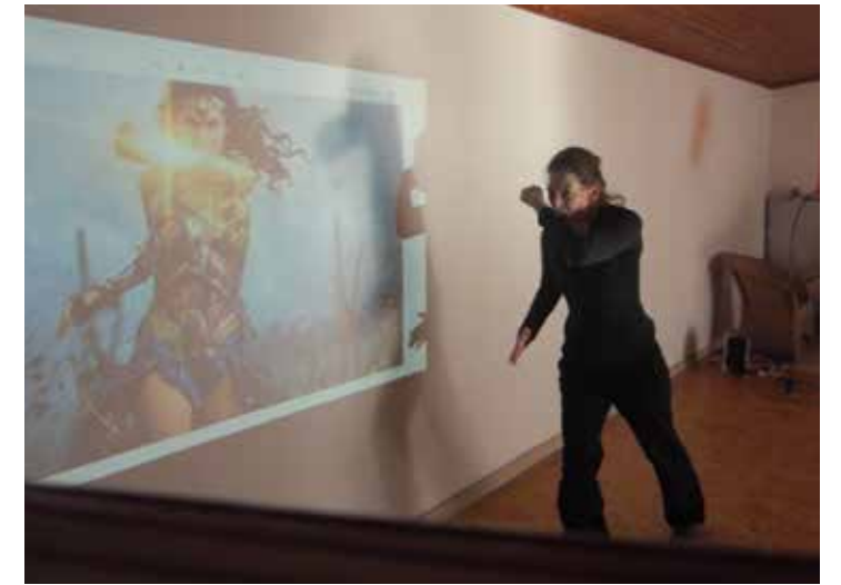
Haltungsarbeit an Wonder Woman

Auszug aus Bertolt Brechts Theaterstück „Die heilige Johanna der Schlachthöfe“. Die Stücke von Bertolt Brecht in einem Band. Suhrkamp Verlag, Frankfurt am Main 1978.