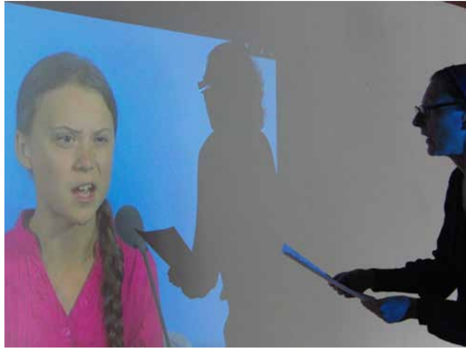
Synchronisation der UN-Rede.

Auszug aus Greta Thunbergs Rede vor der UN / Klimagipfel September 2019